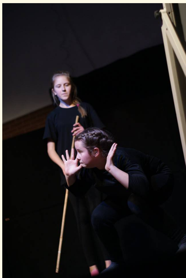
etiuda Pantomimiczna "Szachy" realizowana z dziećmi w ramach Teatrallii Gminnych w Gościnnie